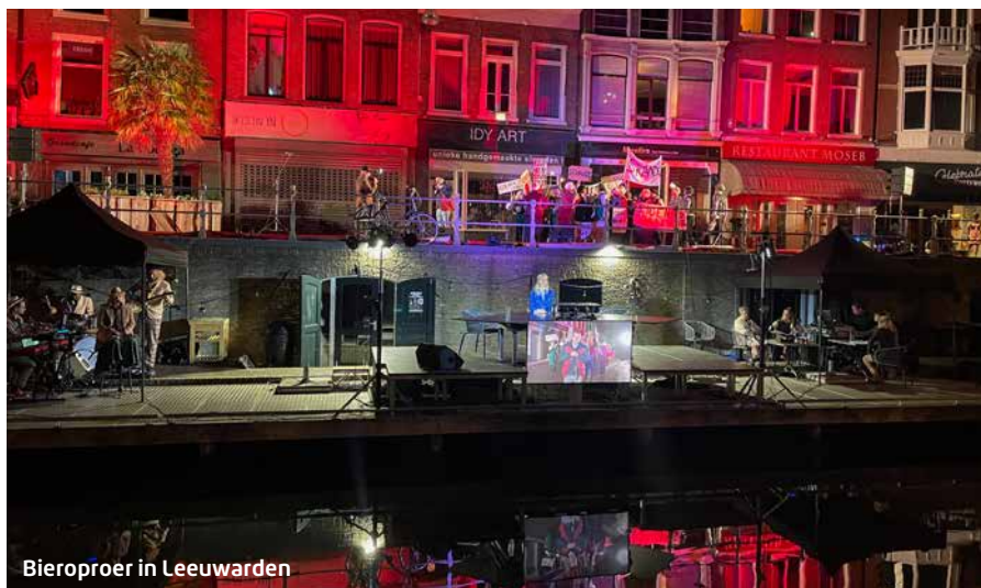
Bieroproer in Leeuwarden

Jan rijdt rond ging van de buis vanwege de lage kijkcijfers. Vervolgens werd Man bijt hond nieuw leven ingeblazen, maar nu bij SBS6. Ik mocht hier meteen aan de slag. Dit was mijn droom, ik vind dat het beste programma in mijn genre. Ook dit gaat over de gewone mensen die iets te vertellen